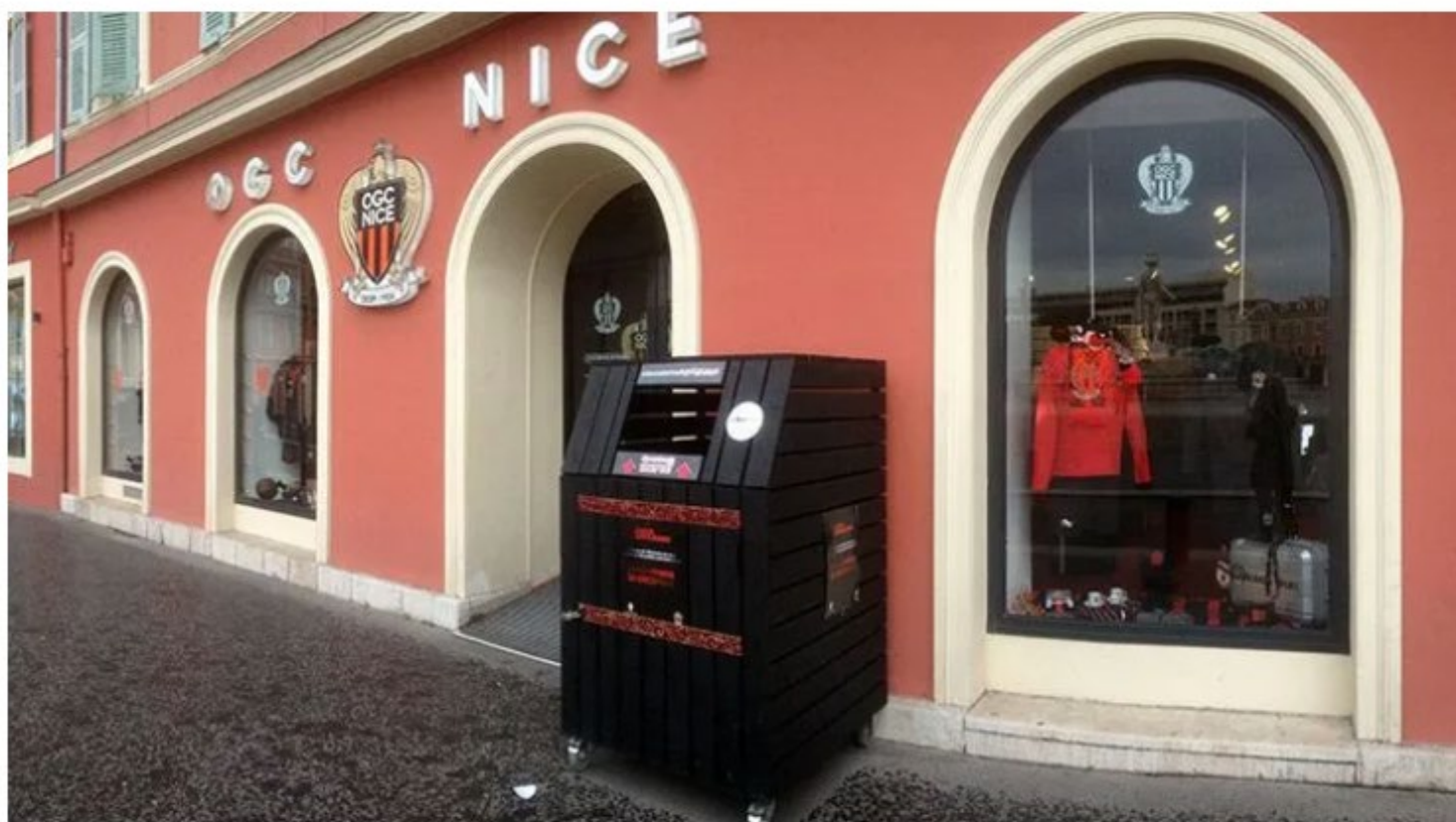
L'OGC Nice propose de nouvelles formules cette saison

Top départ de la campagne d'abonnement à l'OGC Nice pour la saison 2021-2022. Avec un "programme pouvoir d'achat" parmi les offres.